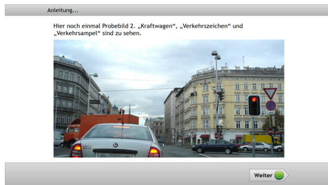
Abbildung 1. Adaptiver Tachistoskopischer Verkehrsauffassungstest zur Überprüfung der Anpassungs - und Beobachtungsfähigkeit im Straßenverkehr 4

Eine Vielzahl der gefundenen Parameter lässt sich sehr gut durch psychologische Tests untersuchen. Diese haben sich in der Praxis bewährt und könnten auf dem Smartphone eingesetzt werden, indem der Fahrer vor Fahrtantritt eine Reihe solcher Tests absolvieren muss, bevor das Fahrzeug in Bewegung gesetzt werden darf. Poschadel und Falkenstein heben besonders das Wiener Testsystem beim Einsatz innerhalb der Verkehrspsychologie hervor [2]. Dieses wird von der Firma SCHUHFRIED GmbH entwickelt und listet insgesamt 113 Einzeltests 3 in verschiedenen Ausführungen zur Überprüfung psychischer Eigenschaften. Beispielsweise sieht man in der Abbildung 1 den Adaptiven Tachistoskopischen Verkehrsauffassungstest (ATAVT), der die Anpassungs - und Beobachtungsfähigkeit eines Fahrers im Straßenverkehr testet. Zudem bietet der Entwickler eine Schnittstelleninteraktion der Testsysteme an, um diese in neue Softwaresysteme einzubetten. Somit wäre eine Integration der Tests in mobilen Apps denkbar.